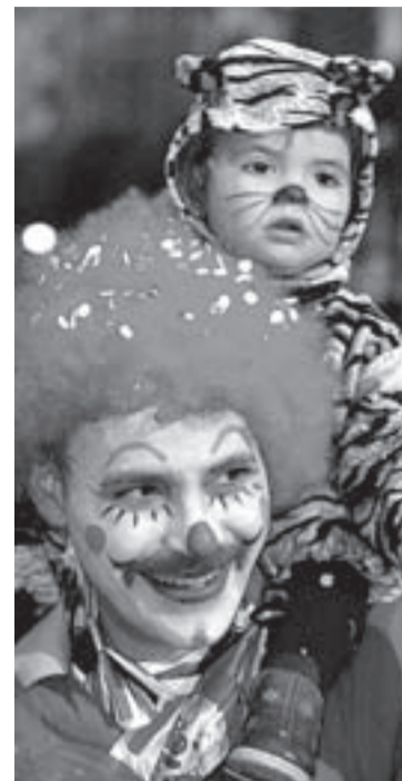
FIESTA. En el desfile se lo pasaron en grande tanto los mayores como los pequeños.