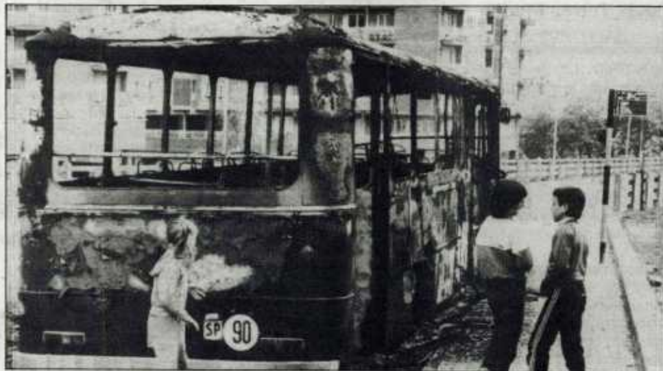
Varios niños juegan junto a un autobús quemado ayer en Hernani.

En líneas generales, la actividad comercial y ciudadana se ha visto paralizada puesto que los comercios, entidades bancarias y centros docentes han permanecido cerrados al público. Los transportes públicos no han llegado a funcionar, y de la misma forma ha sido nula la actividad en el Ayuntamiento, donde única-