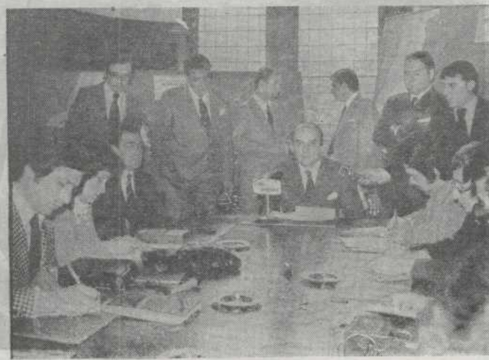
El ministro en la rueda de prensa.

Según nos explicaron los técnicos, ha sido necesario construir unas importantes instalaciones de ventilación dada la longitud de los túneles de Malmásin (1.300 metros). Entre otras cosas, en el edificio se controlan las colisiones, el enrarecimiento del aire y la opacidad. En él se ha montado un tablero de mandos que permite conocer la pureza del aire y regularla. Situados en lugares estratégicos, en los túneles hay timbres de alarma para caso de accidentes y en el futuro se piensa instalar un circuito cerrado de televisión. También se han montado extintores y hasta semáforos para cortar el tráfico en cualquier momento. La pureza del aire se regula automáticamente por un sistema de ventilación semitransversal (ventiladores de 150 kilovatios de potencia), más importante en el túnel de acceso a Bilbao porque los vehículos tienen que superar una pendiente ascendente. Si se averiara la automatización de los ventiladores y el enrarecimiento del aire fuera el máximo permitido, sonaría un sistema de alarma que obligaría a cortar el tráfico. Ocho hombres trabajarán diariamente en el edificio de control, para que el servicio sea permanente.