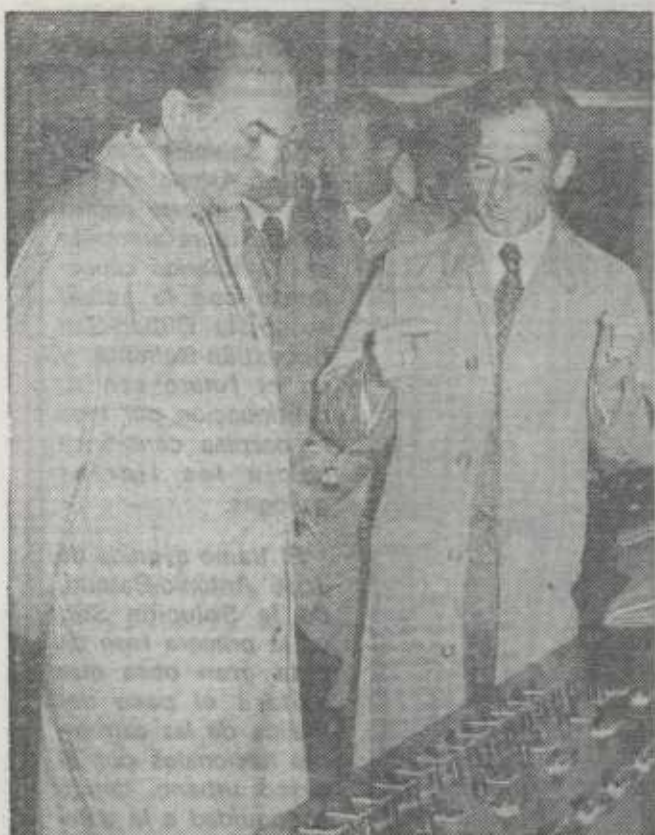
Sobre uno de los paneles que controla la pureza del aire del túnel, el ministro de Obras Públicas escucha las explicaciones técnicas.