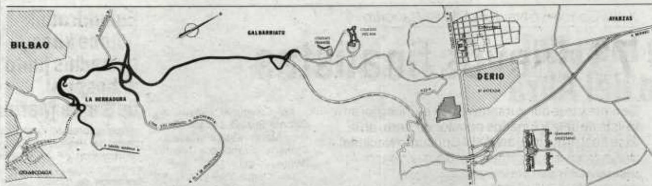
El mercado en oscuro es el ramal inaugurado ayer. En tres semanas se prevé la entrada en servicio del tramo hasta Ayarzas

El lehendakari remite a la transferencia de la Seguridad Social el conflicto de la Intermutual de Archanda