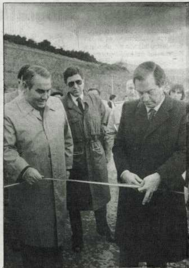
El lehendakari cortó la cinta de la nueva Herradura

En el transcurso del acto de inauguración, trabajadores del Centro Intermutual de Archanda se encartelaron y una representación entregó al lehendakari un escrito en el que expresan su situación y reivindicaciones que se centran en la apertura de negociaciones entre la Seguridad Social y las Mutuas Patronales, fundadoras del centro, la negati-