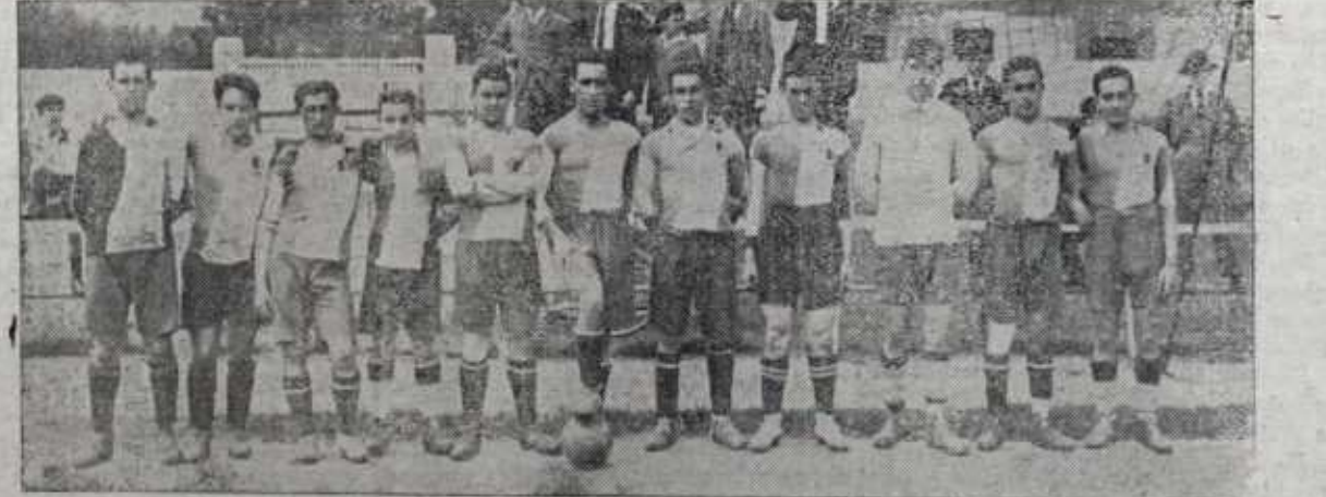
EQUIPO DEL BANCO DE VIZCAYA, GANADOR DE LOS BANCARIOS

Desierto.—(Tres secciones).—Carranza: primera, 158; segunda, 152; tercera, 161.—Saracho: primera, 158; segunda, 182; tercera, 161.—Urñen: primera, 158; segunda, 182; tercera, 161.—Merodio: primera, 62; segunda, 51; tercera, 75.—Carretero: primera, 50; segunda, 51; tercera, 75.—Mairal: primera, 51; se-