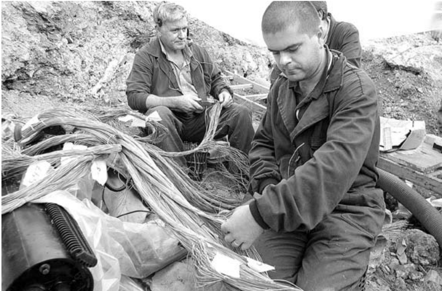
TRABAJO MINUCIOSO. Operarios de Telefónica seleccionan una por una las líneas seccionadas en Juan de Garay.