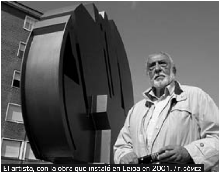
El artista, con la obra que instaló en Leioa en 2001.

En su opinión, «un museo debe ser un lugar neutro donde los protagonistas sean el arte y el espectador. Todo lo demás sobra. Es también un poco lo que pasa con el Guggenheim. El museo debe ser neutro y gris, y un lugar en el que desaparezca la arquitectura.