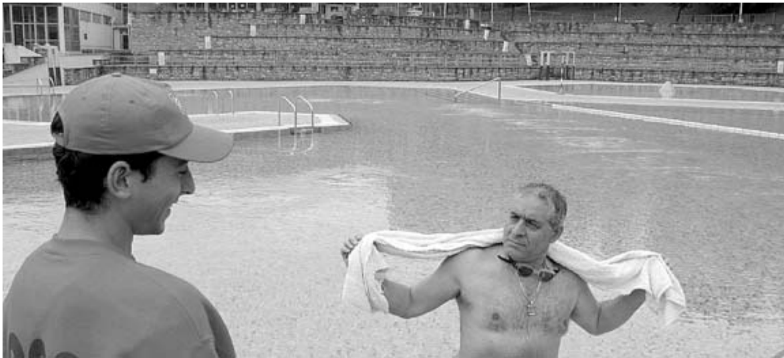
SOLOS. Un socorrista de Txurdinaga charla con un bañista en un día lluvioso de finales de agosto.

Iberia instala en Loiu máquinas de autofacturación para reducir las esperas Sólo podrán usarlas los viajeros sin equipaje