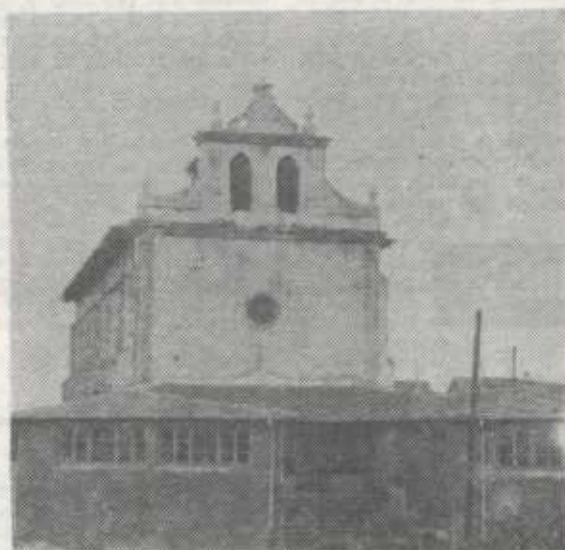
En este edificio, antigua Iglesia de San Cristóbal de Repélagu, funciona actualmente la Escuela de Formación Profesional de Portugalete, que se ha quedado insuficiente y necesita una ampliación urgente.

el Ayuntamiento de Portugalete. A. ARNEDO