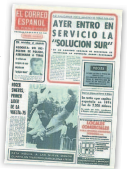
Imágenes de las obras y portada del día de la inauguración.