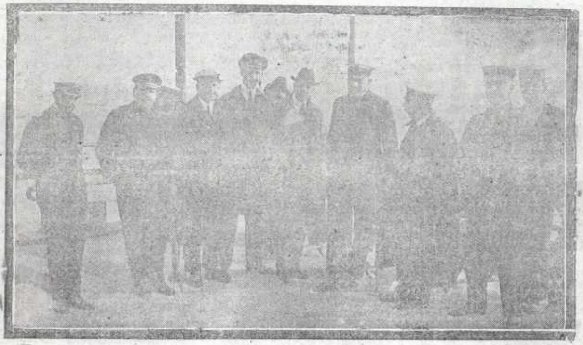
EL JURADO DE LAS REGATAS DE LA ALMIRANTA CELEBRADAS EN EL ABRA

REGIONAL Vitoria, 30. ABANDON Vitoria ha abandonado el aspecto de las grandes ciudades. Una apaciguada multitud situada a todo lo largo del itinerario, acogió a los monarcas con estruendos vivas e indescriptibles aclamaciones. Los balcones del itinerario estaban atestados de público principalmente señoras y señoritas, que agitando sus pañuelos saludando a los Reyes, que correspondían a los saludos visiblemente emocionados por tan magno recibimiento. EN LA CASA DE LA CIUDAD Al llegar los Soberanos al Ayuntamiento, el entusiasmo del público se desbordó de un modo incontrolable. Una compañía del Regimiento de