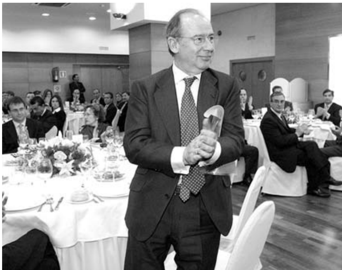
ENCUENTRO. Rodrigo Rato asistió ayer en Vitoria a un almuerzo con empresarios.

Hidrocantábrico podrá adquirir el 62% de Naturcorp aunque se limite su capacidad de gestión