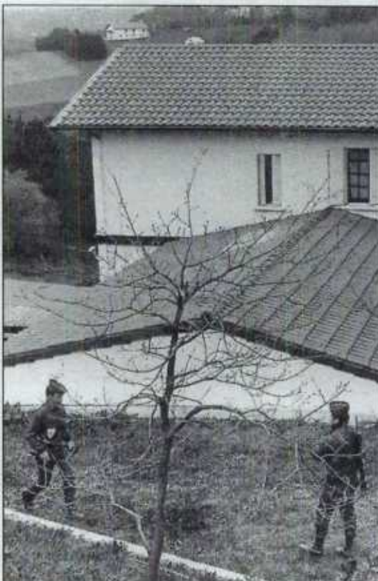
Imagen del chalé de Bidart donde fue detenida la dirección de ETA. A la derecha, Philippe Lassalle tras su captura.

El resto de los movimientos económicos detallados en los documentos de Bidart se refiere al pago de viajes efectuados por diversas personas, así como a la entrega de diferentes cantidades