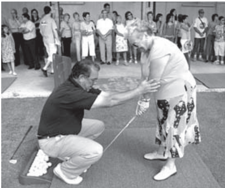
PRUEBA. Un monitor corrige la posición a una visitante.

Los que repiten dicen que lo mejor es acudir de lunes a jueves, porque los fines de semana «hay muchísima gente». El viernes es uno de los días de mayor actividad en el recinto.