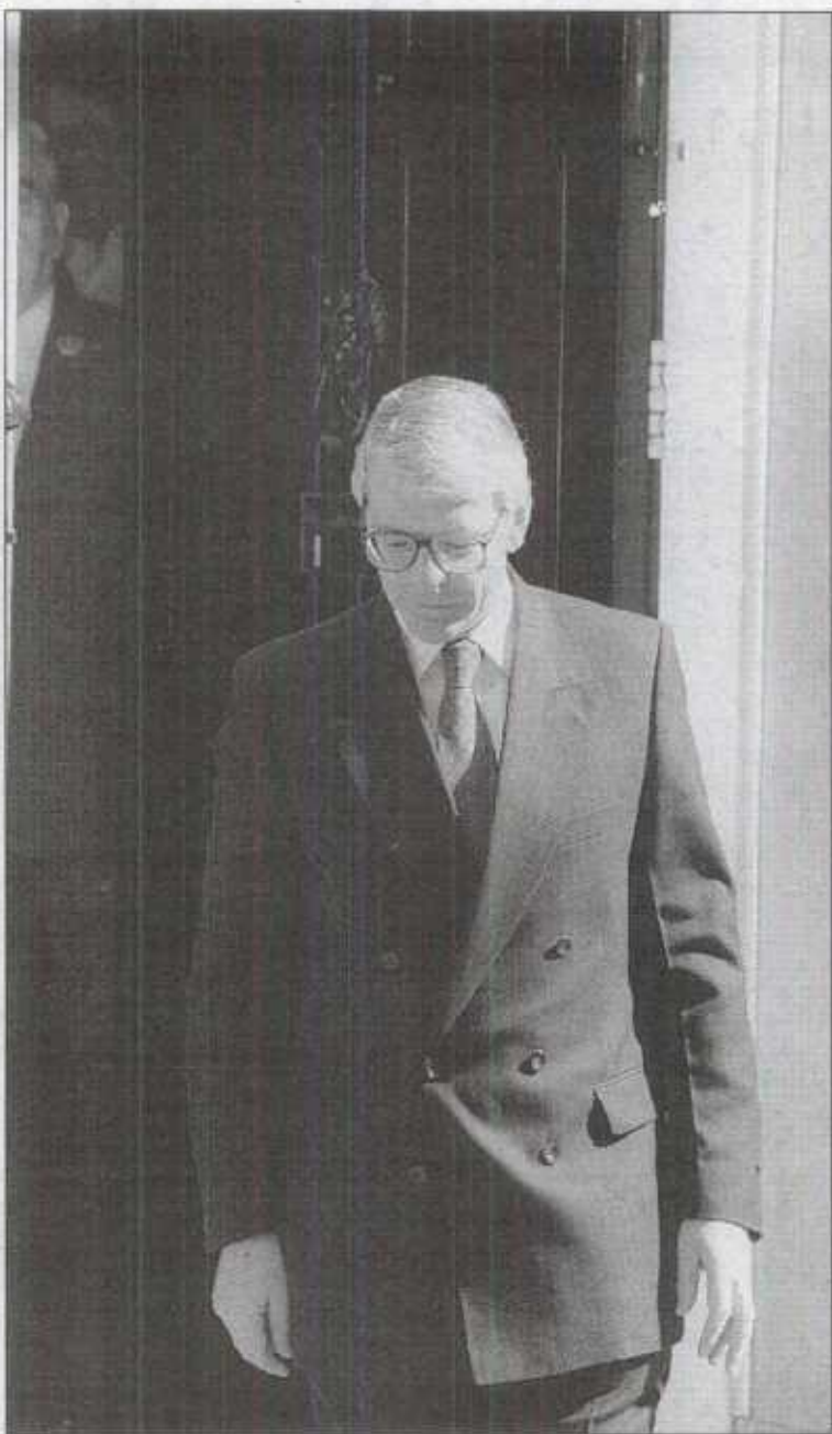
El primer ministro John Major sale de su residencia.

Por eso también, se sugiere que el primer ministro podría convocar una inmediata elección en su partido para reafirmar su liderazgo y así ahorrarse una larga batalla. Se exige además que el partido se una en aquellos asuntos men-