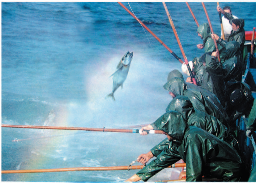
pero es el futuro

Así se pesca el Bonito del Norte desde hace siglos. De uno en uno. Con artes de pesca tradicionales,