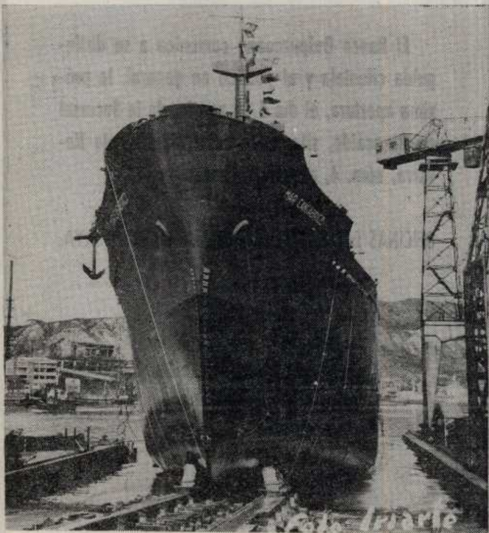
El "Mar Cantábrico" se desliza por la grada entrando en las aguas de la ría.

Esloa entre perpendiculares, 131,71 metros. Esloa total, 142,50 metros. Manga de trazado, 19,80 metros. Puntal a la Cta. Shelter, 12,10 metros. Puntal a la Cta. principal, 8,90 metros. Calado completo Shelter abierto, 7,87 metros. Calado completo en carga como Shelter cerrado, 9,32 metros. Capacidad de carga en grano, 665.118 pies cúbicos. Capacidad de carga en balsas, 604.619 pies cúbicos.