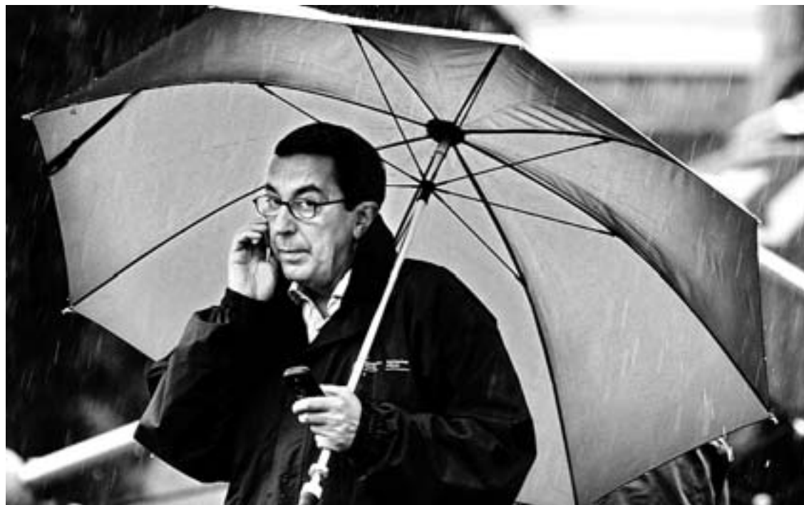
CON LAS BOTAS PUESTAS. Bilbao siguió el curso de la crecida sobre el terreno.

En este sentido, el diputado general destacó la importancia de las obras hidráulicas realizadas desde 1983 y animó a las administraciones vascas a «continuar con las inversiones» para mejorar y adecuar el cauce de los ríos.