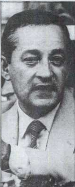
Pedro Aurteneche ha replicado a las declaraciones de los tres jugadores que causan baja, que acudieron a la rueda de prensa en compañía del abogado Juan Elejalde y de los hermanos Salinas.

Sobre la referencia de Urkiaga al «montón de dinero» que ha costado el fichaje de Howard Kendall, Aurteneche apuntó que «el costo de Kendall, comparativamente, no está muy distante de lo que han venido cobrando los anteriores entrenadores del primer equipo». En este sentido, el presidente apuntó que «en la trayectoria económica del Athletic no hay lugar para los dispendios», destacando, sin embargo, que «nuestros jugadores reciben una contraprestación económica de nivel alto, sólo superado por los