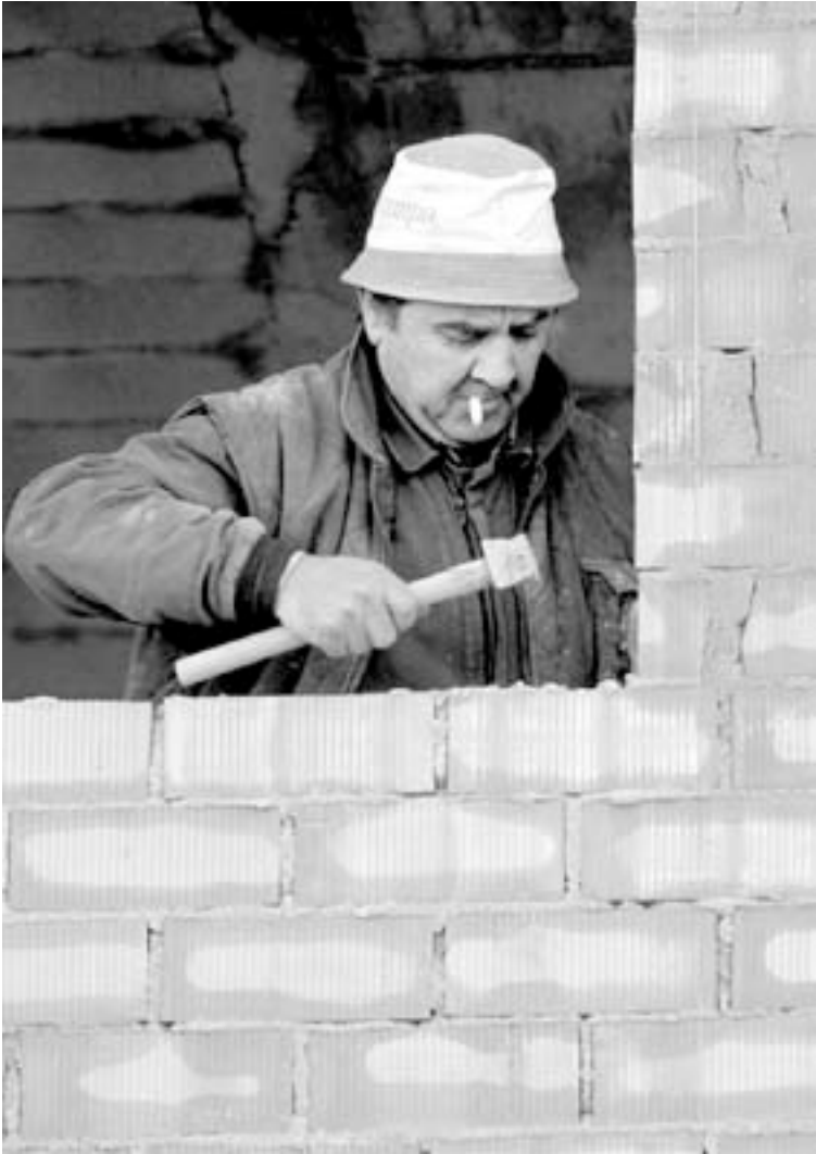
SIN ACABAR. Un albañil trabaja en un piso.

La pasada semana, alcalde y concejales suspendieron la reunión prevista por discrepancias de índole política. En el debate sobre el estado de la ciudad del lunes y el martes, sin embargo, todos defendieron con ahínco la necesidad