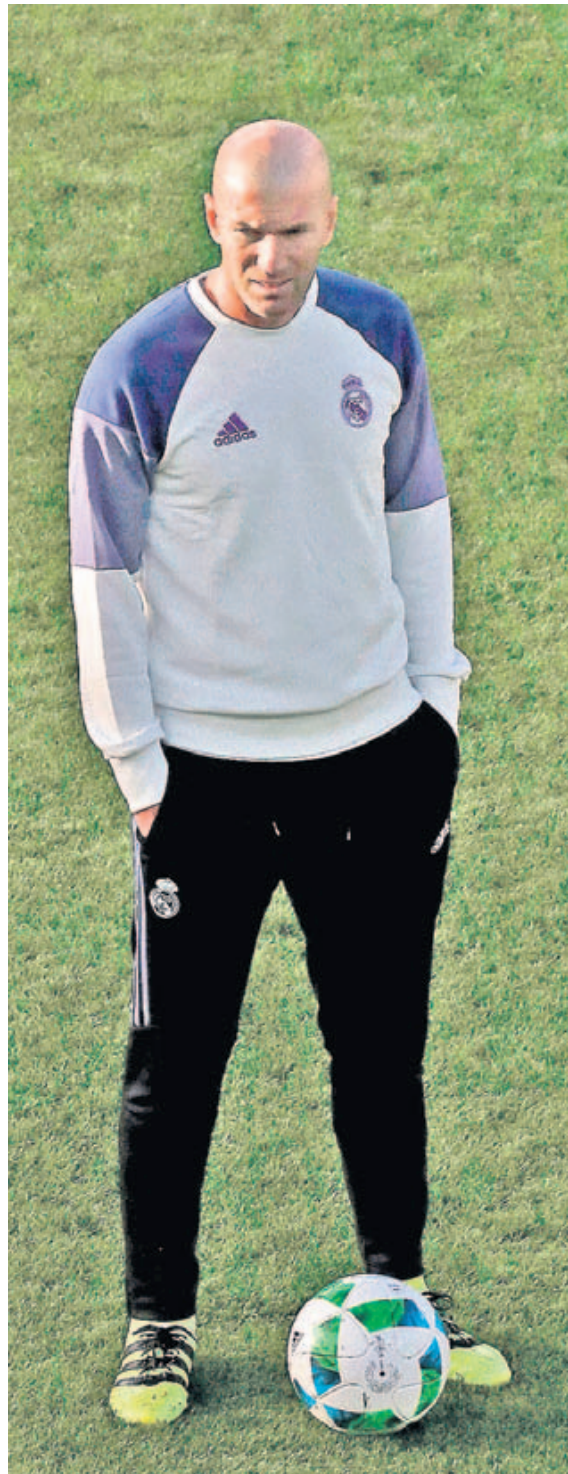
Sampaoli y Zidane, en los entrenamientos de sus equipos en Noruega.