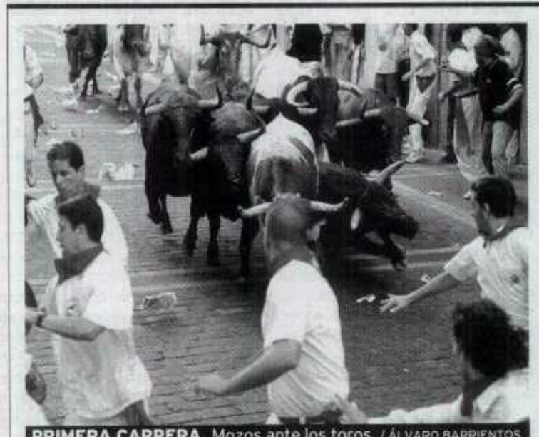
PRIMERA CARRERA. Mozos ante los toros.

El quinto fue muy noble. Relajado, habilidoso, Puerto brindó al público una faena que, rugiente de inicio -pase cambiado por la espalda en los medios-, iba a acabar siendo la clásica faena de sol. Por abusar de la distancia corta, la faena tuvo su bache, pero Víctor, listo, remontó con un espectacular final: ayudado a dos manos y a pies juntos por alto. Populismo bien servido. Y una estocada en buen sitio, perpendicular y de efecto tardío que sirvió para abrochar un notable éxito.