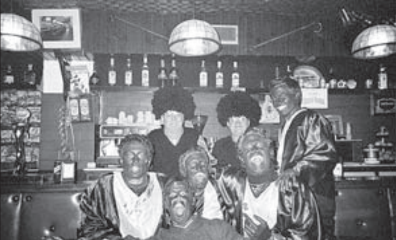
RESACA. El coro de gospel en plena actuación por el Casco Viejo.

* La local -música de David el Gnom- Soy un borracho, / el más alcohólico del lugar, / de mi casa salgo yo / pensando en privar.