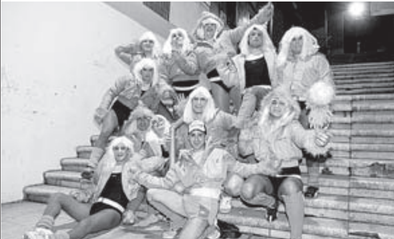
DIVINAS. Los ‘vasolaris’ de Castro, enrolladas Madonnas. / P. URRESTI

Voy a Iturri, / ‘katxis’ empiezo a acumular / y llegando a Barrenka / el primero en potar.