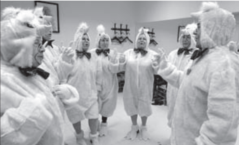
PELIGROSOS. Los pollos vitorianos en pleno ensayo.