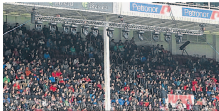
Focos instalados en una de las tribunas de San Mamés.