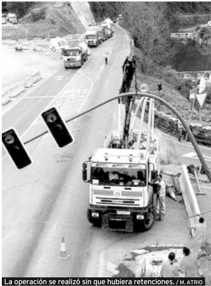
La operación se realizó sin que hubiera retenciones.

Al final, Javier fue localizado por su hermano, que tenía las llaves de su casa y se acercó a echar un vistazo. Lo encontró felizmente dormido, ignorante de su falsa condición de víctima y con el teléfono desconectado. Claro que, en realidad, sí que tuvo algo de víctima: con los nervios y las explicaciones, el pobre ya no pudo volver a pegar ojo en toda la mañana.