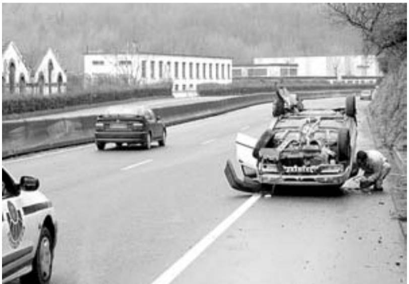
La N-634 en Galdakao constituye un 'punto negro' de la red vial.

J. L. Rúa critica: «El Ayuntamiento de Sopelana quiere implantar el civismo en el municipio. Más de 300 vecinos de la calle Eleizalde venimos denunciando el problema de las aceras, que son estrechas (unos 50 centímetros). No pueden pasar las sillas de minusválidos, ni coches de niños. Los vehículos, además, circulan a gran velocidad. No ha habido respuesta municipal en dos años. ¿Qué es? ¿Civismo o cinismo?».