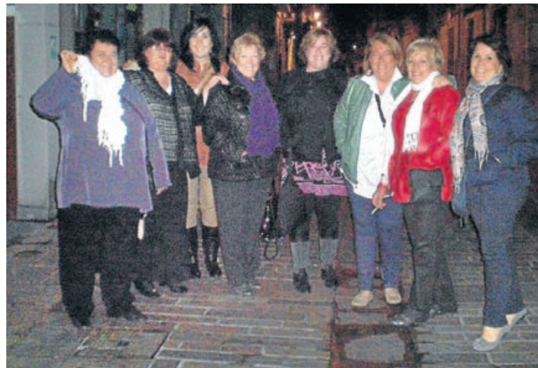
«Felices fiestas a mis tías y primas . ¡Para un día que salimos de cena, el pueblo estaba desierto y no había nadie con quien bailar!».