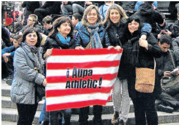
«Aquí están las 'Bielsa neskatxos' en Trafalgar Square, Londres, animando a nuestro Athletic».