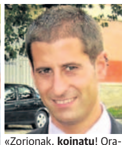
«Zorionak, koinatu ! Ora-in kafetxo baten zain geratzen gara, eh? Zure koinatu eta koinata».