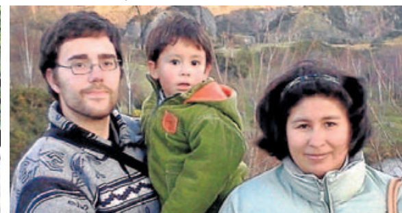
«Desde hace tres años, eres la felicidad de la casa. Zorionak, C.K. ».