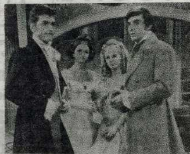
Una escena de «El hombre del mundo», que hoy pone en pantalla «Estudio 1».

Fueron muchos los telespectadores de la región vasca que el pasado sábado pusieron el U.H.F. a las nueve de la noche. Se había anunciado, cosa rara, la intervención de un cantante de nuestra región, Patxi Andión, que ocuparía veinticinco minutos dedicados a él por completo. La decepción fue general y la tomadura de pelo especial para nuestra región, ya que de Andión nada se supo y se ofreció la actuación de una cantante extranjera. Otra broma inexplicable desde todos los sentidos. Se impone una mayor seriedad.