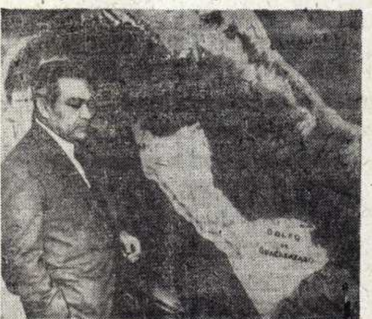
El ex presidente Batista, ante el mapa de su patria. Como se sabe, ha preferido abandonar el poder antes de que continuara el derramamiento de sangre en Cuba.

Fidel Castro nació en la provincia de Oriente y conoció a fondo la precaria situación de los campesinos. Fidel Castro marchó a estudiar el Bachillerato en el Colegio de Belén, de los