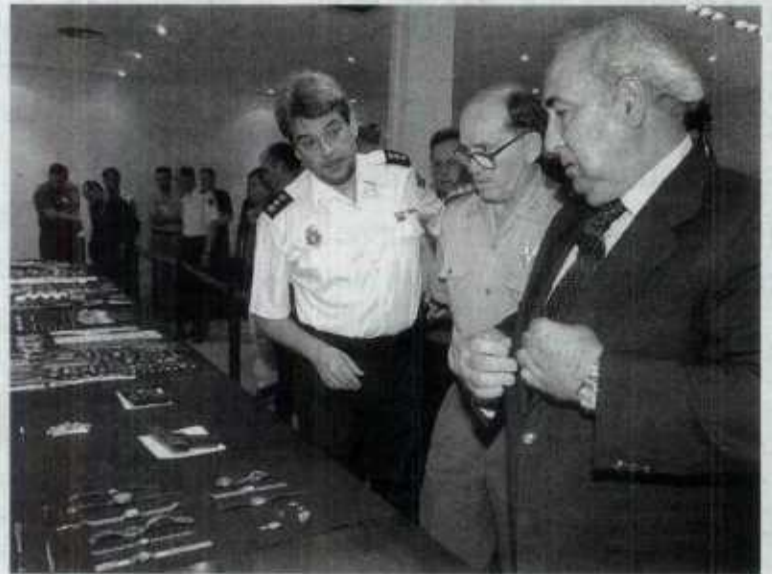
El delegado del Gobierno en Madrid, con el material incautado.

Efectivos de la Policía y de la Guardia Civil han detenido en Madrid, en una operación conjunta, a veintiséis personas, la mayoría colombianos, sospechosos de ser miembros de una banda organizada dedicada al atraco en joyerías y a representantes del gremio.