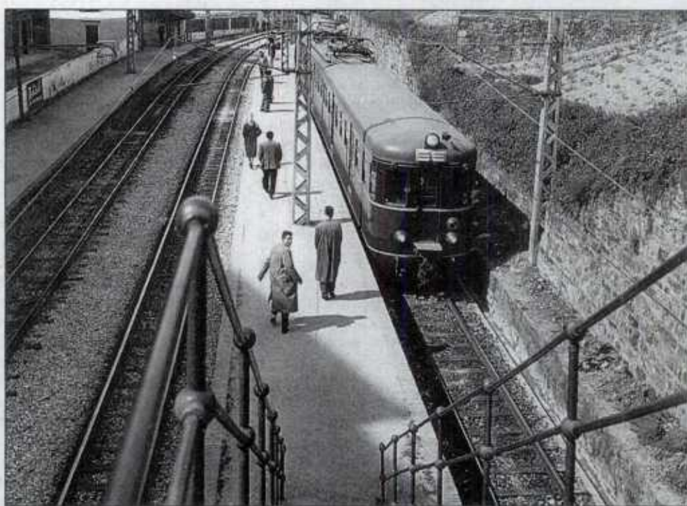
Un tren de Eusko Trenbideak entra en la estación de Matico.

Los mensajes dirigidos a esta sección con quejas, sugerencias o consejos deben ser breves. La Redacción podrá reducir aquellos que por su extensión no puedan ser transcritos literalmente. El mensaje ha de estar debidamente identificado con nombre, apellido y número de teléfono. Los lectores que lo deseen pueden ilustrar sus quejas con una fotografía.