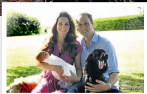
El rey maorí Tuheitia Paki, durante un acto de las tribus neozelandesas. Abajo, los duques de Cambridge con su hijo y un perro.

coloco. Es precisamente el ceremonial de danzas y saludos de rigor lo que, según explicó ayer el primer ministro neozelandés, John Key, va más allá de los noventa minutos fijados desde Inglaterra. Y Guillermo lo sabe. Es más, no hace mucho, en 2010, en su último viaje oficial a Australia y Nueva Zelanda, el hoy duque de Cambridge ya fue recibido por el rito maorí, como sucedió un año antes, dígame de paso, con don Juan Carlos y doña Sofía.