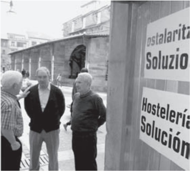
PROTESTA. Los hosteleros reclaman una solución.

En el escrito, los hosteleros solicitan también la apertura de «cauces permanentes de diálogo» para tratar de alcanzar un consenso en esta situación de «incertidumbre» en que se encuentra el sector en Durango. Piden al Ayuntamiento que concrete cuándo definirá las categorías de todos los estableci-