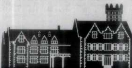
Palacio de la Magdalena