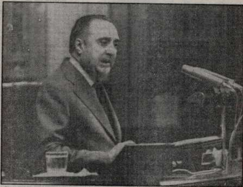
El ministro del Interior durante su intervención en el Pleno del Congreso.

Crónica de nuestro corresponsal, José Luis Torres Murillo