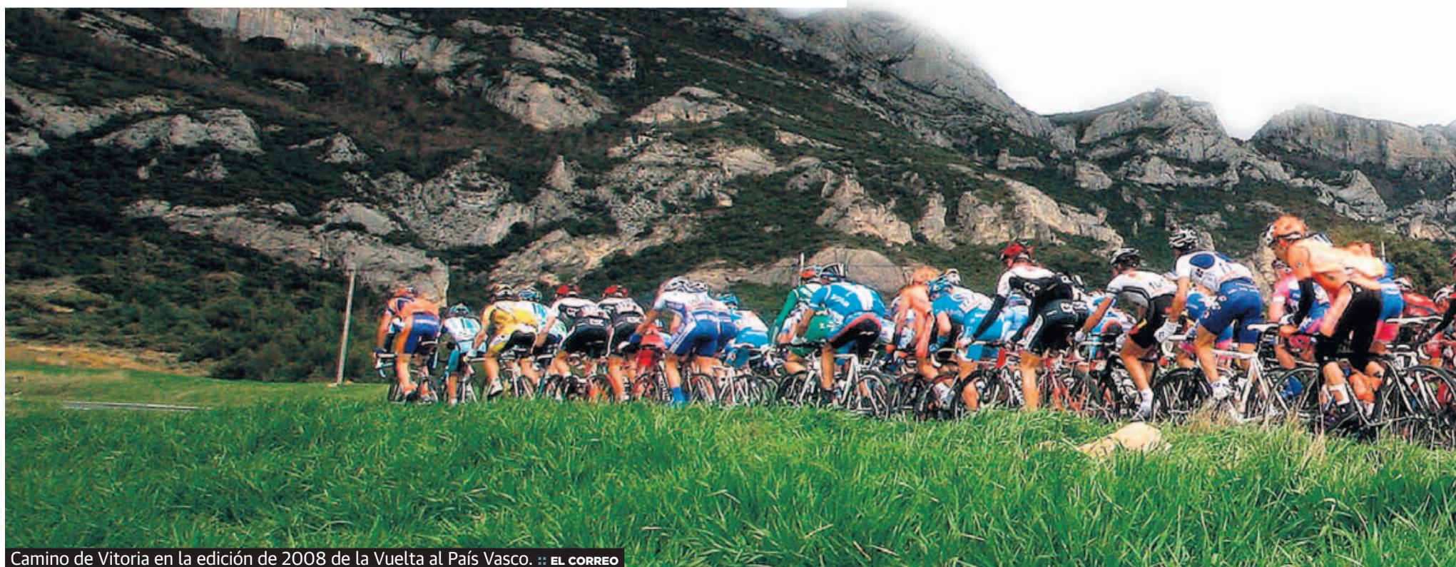
Camino de Vitoria en la edición de 2008 de la Vuelta al País Vasco.