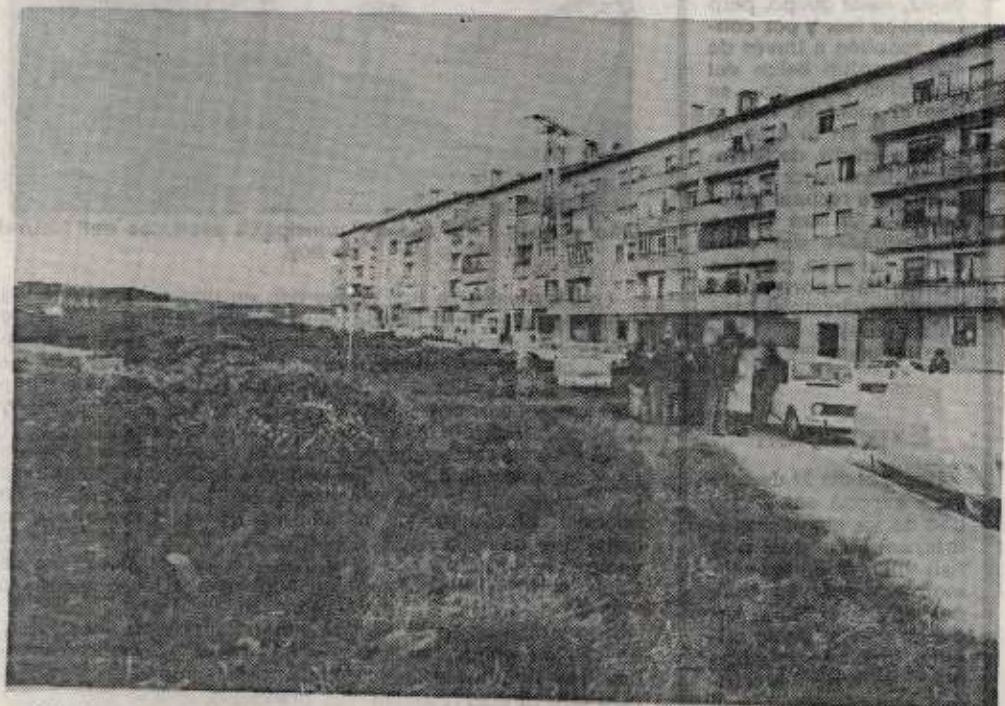
A la izquierda de la fotografía puede verse la posible zona de expansión que en estos momentos es escenario de los safari contra las ratas.

Las peticiones de los vecinos continuaron en los locales de la oficina municipal de Abechuco, donde el alcalde se reunió con las fuerzas vivas del barrio por espacio de más de dos horas. Como era de esperar, volvió a surgir el problema de la falta de vigi-