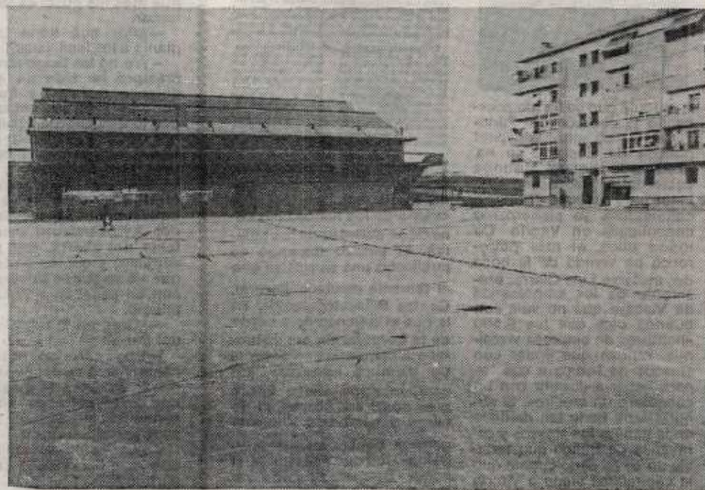
El piso estropeado y la ausencia de árboles son las notas más destacadas de esta plaza, centro de reunión de los vecinos del barrio.

Avda. Generalísimo, 33-4º izda. ☎ 223624. VITORIA