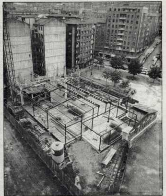
La construcción de la iglesia de Recalde fue paralizada cuando ya estaban levantadas las estructuras.

serva para el emplazamiento de una plaza, un centro cívico y un edificio público reservado a mercado... No es posible atender la alegación de la Administración demandada, en el sentido de que la polivalencia de destinos considerados en el Plan Parcial para el edificio central del centro cívico, bajo la genérica determinación de servicios municipales, pueda dar lugar al uso pretendido por la Diócesis de Bilbao». La sentencia desestima, no obstante, uno de los motivos del recurso vecinal basado en la existencia de caminos públicos que atraviesan la zona, por no estar incluidos en la nueva vialidad, ni constar su propiedad municipal inequívoca.