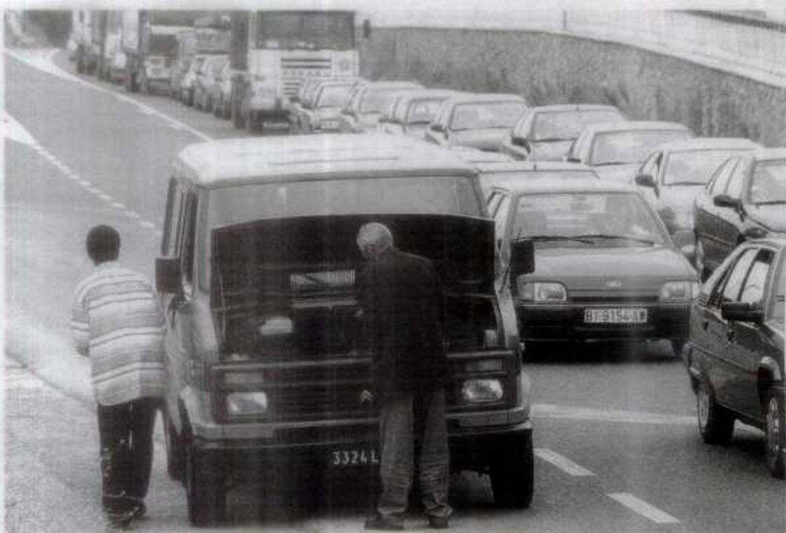
CARAVANAS. El paso de inmigrantes desde Francia hacia el sur de la Península colapsó la A-8.

Al impedir tanto agentes de la Ertzaintza como de la Policía Municipal de Amorebieta el acceso por este tramo de la N-634, muchos conductores decidieron utilizar la autopista como vía de escape al bloqueo de la carretera nacional. La alternativa tampoco sirvió de mucho, ya que la entrada en el peaje de Durango comenzó a registrar importantes retenciones,