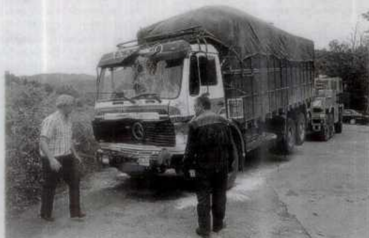
Dos camiones colisionaron de frente en Euba.

Los problemas de tráfico afectaron también al nudo de Basauri. El inicio de la segunda quincena de julio volvió a notarse, como cada año, en las carreteras. El tránsito masivo de inmigrantes desde el sur de Francia hacia sus países de origen, en el norte de África y en Portugal, colapsó el enlace de la A-8 con la A-68 a la altura de la localidad vizcaína y la BI-625 en Arrigorriaga. Las retenciones comenzaron alrededor de las diez y media de la mañana y se prolongaron hasta las dos y media de la tarde. El monumental atasco obligó incluso a cerrar los peajes de la autopista en Usansolo y Amorebieta.