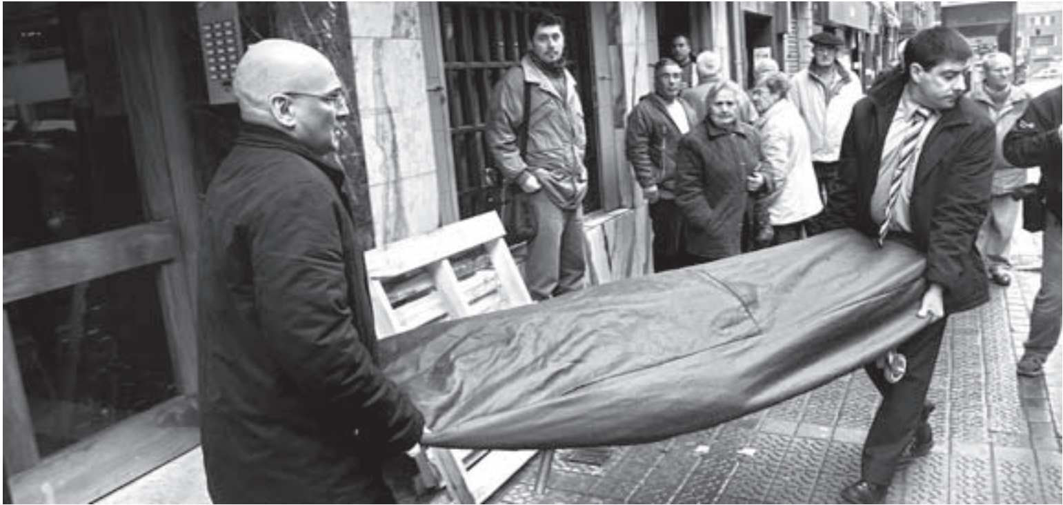
VIOLENCIA DE GÉNERO. Los forenses trasladan el cuerpo de la víctima en el barrio bilbaíno de Zorroza.