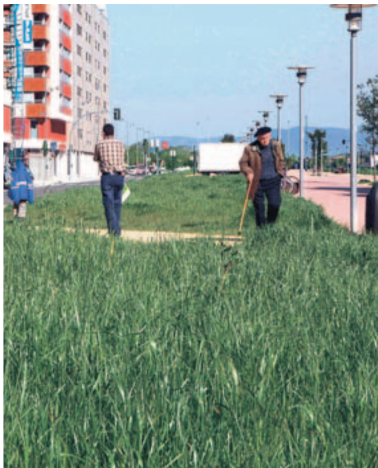
Los vecinos se quejan del abandono de los jardines.