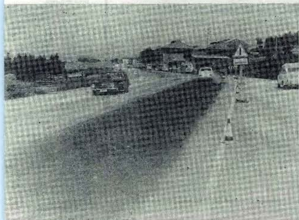
Al fondo termina la autovía. En este lugar todavía no está terminada y si bien ayer fue recubierta con la última capa de rodadura, es muy posible que las obras no queden terminadas hasta los primeros días del mes de septiembre.

—Tal vez por desconocimiento. Creo que ahora van a asistir a la convención varios observadores de Logroño, Pamplona y otras capitales.