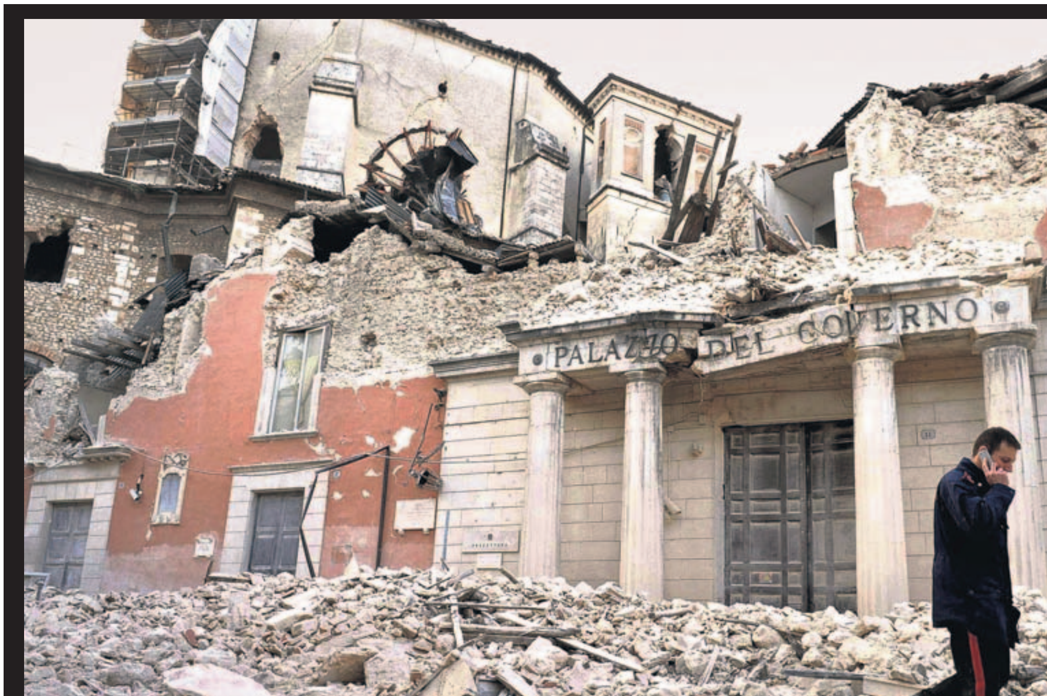
ENTRE CASCOTES. Un 'carabinieri' habla por el móvil mientras camina frente al destruido edificio histórico del Ayuntamiento de L'Aquila.