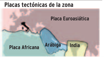
GRÁFICO: ALBERTO LUCAS

Todo ha caído como una miniatura. Igual ocurre en los municipios, muy antiguos. Sulmona, por ejemplo, era el pueblo de Ovidio. Además de la gigantesca tragedia humana, es todo un patrimonio cultural el que queda herido de muerte. Pero por lo visto hasta ahora, muchos de los edificios derruidos son modernos y es especialmente