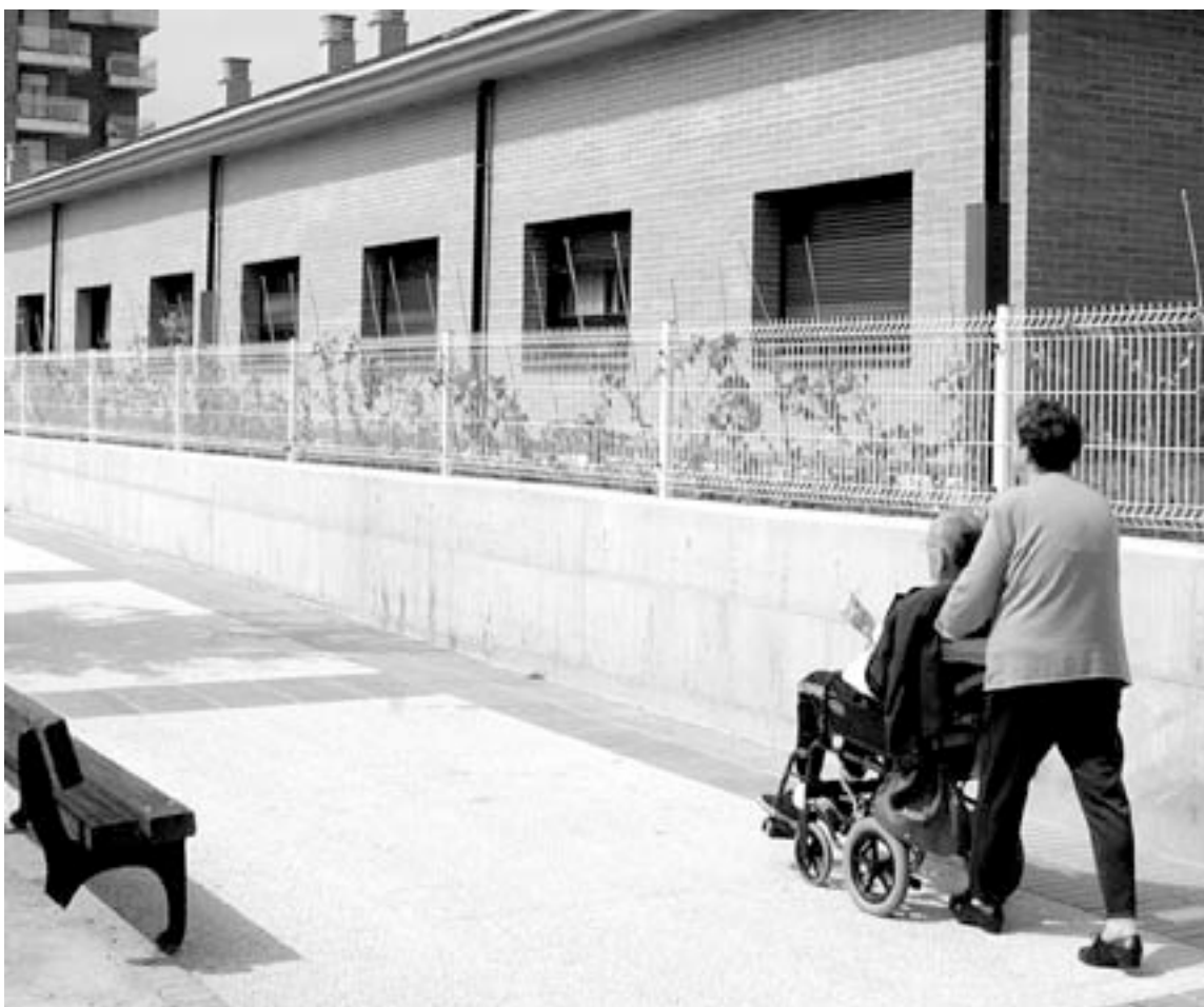
UN ANCIANO pasea con un familiar, por las inmediaciones de la residencia Ariznavarra.

La central nacionalista ha adoptado esta drástica medida al percatarse durante el proceso electoral que «sólo 3 de los 110 empleados eran fijos». Estos datos fueron ayer matizados por la dirección del geriátrico. La responsable del centro señaló que son 95 las personas que integran la plantilla. Añadió que desde el pasado junio –fecha en la que comenzó a cumplirse el primer año de trabajo de los primeros que se incorporaron–