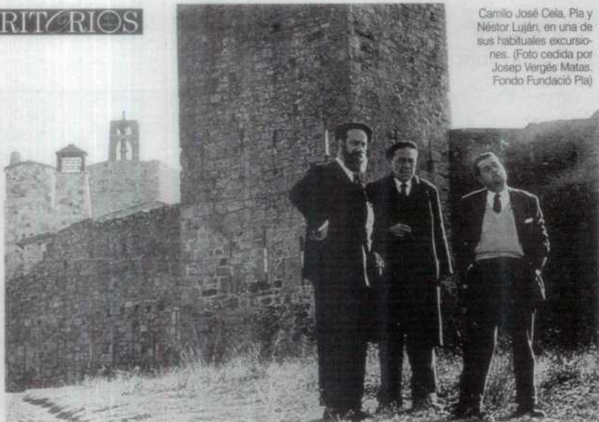
Camilo José Cela, Pla y Néstor Luján, en una de sus habituales excursiones.