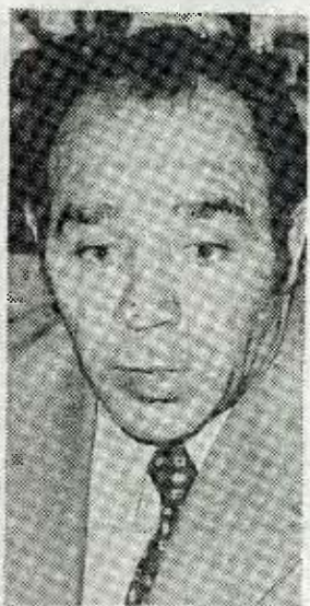
EL DÍA 29. PRESENTACION