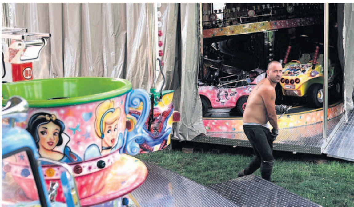
Se instalarán 25 aparatos, 35 casetas de juegos y espectáculos y 12 locales de hostelería.

► Nuevas figuras. López Simón, Garrido y Rey aspiran atraer espectadores la tarde del viernes.