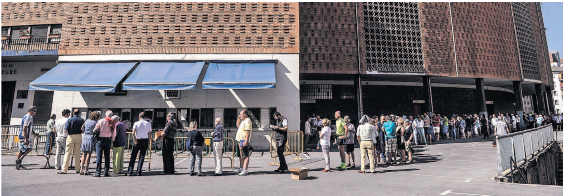
Decenas de personas hicieron cola a las puertas de las taquillas, algunas desde las siete de la mañana. Las esperas no terminaron hasta después de mediodía.