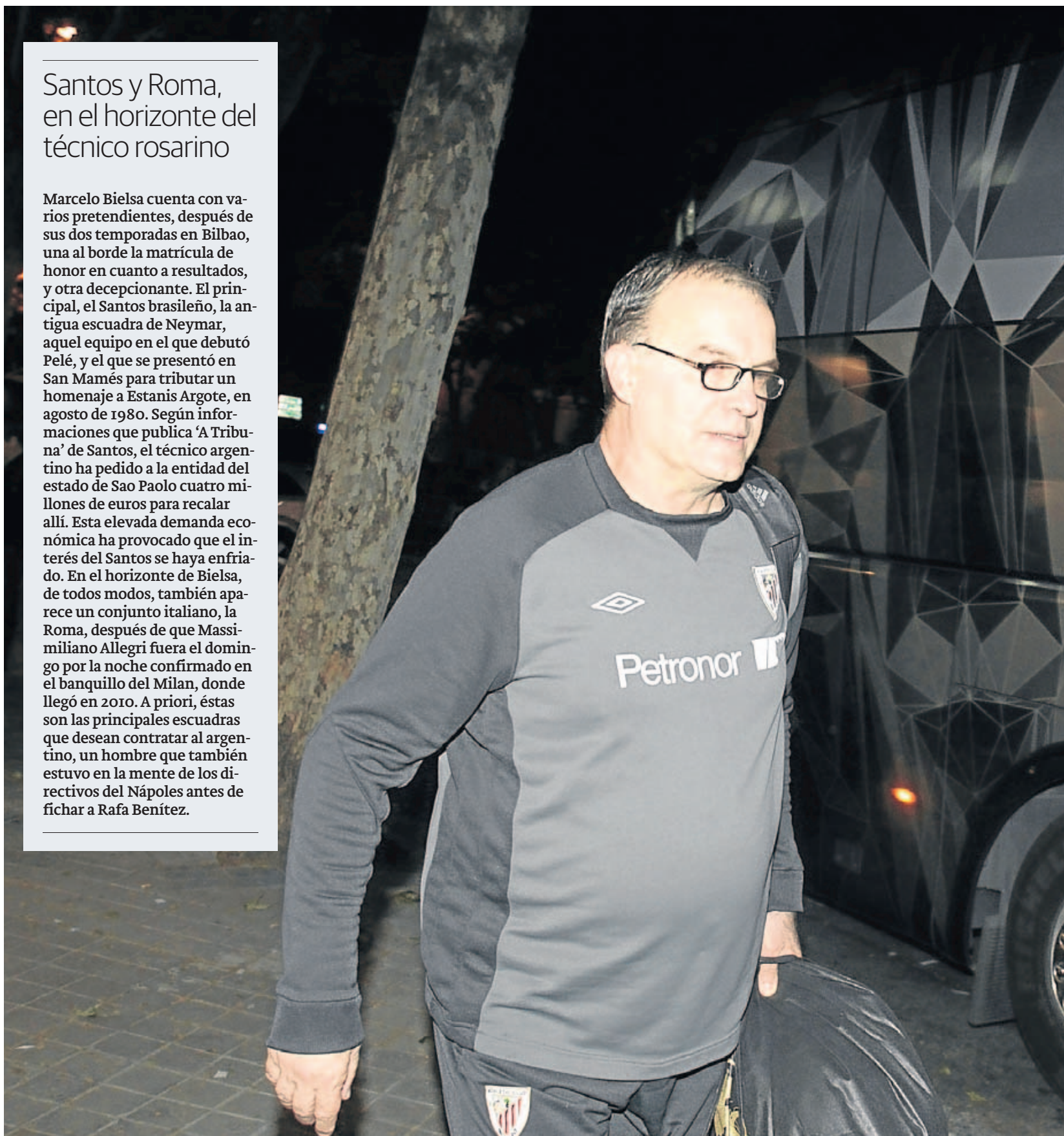
Despedida. Marcelo Bielsa se dirige al autobús del Athletic tras concluir el partido de Vallecas.