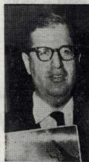
al "asunto", "es cierto que estamos en discusiones con

"Lo importante, dijo, son las relaciones de conjunto con Francia". Después añadió, refiriéndose a la política de "suavizamiento" de embargo, que habría sido proyectada con antelación