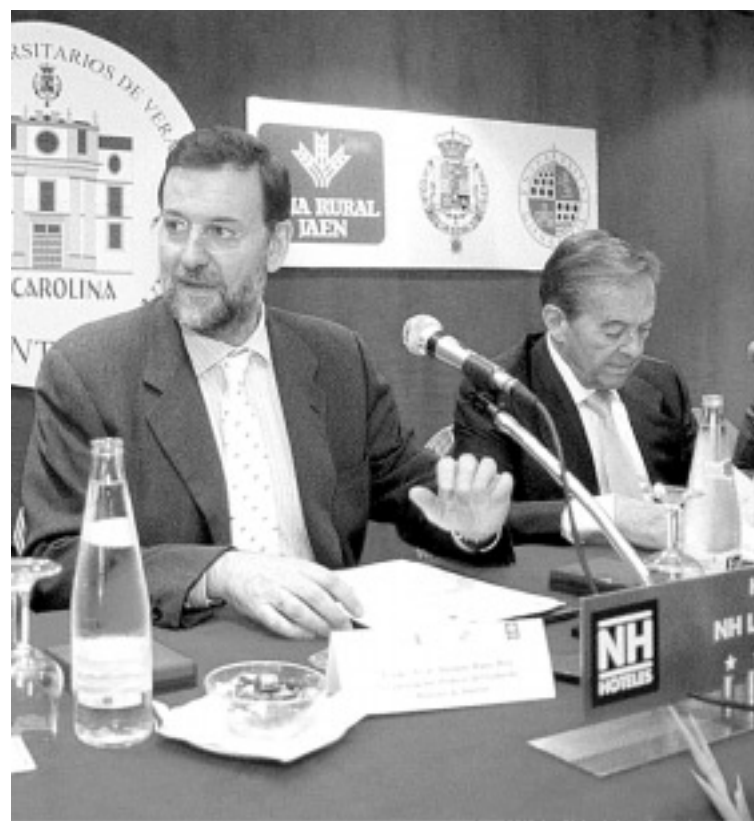
Mariano Rajoy participó ayer en un acto público en Jaén.

Confebask pide a ambos presidentes que intenten abrir «un diálogo sincero»